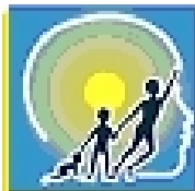
SOCIETÀ ITALIANA DI NEUROPSICHIATRIA DELL'INFANZIA E DELL' ADOLESCENZA