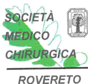
SOCIETÀ MEDICO CHIRURGICA ROVERETANA