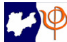
ORDINE DEGLI PSICOLOGI DELLA PROVINCIA DI TRENTO