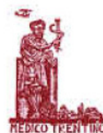
ORDINE DEI MEDICI E DEGLI ODONTOIATRI PROVINCIA AUTONOMA DI TRENTO